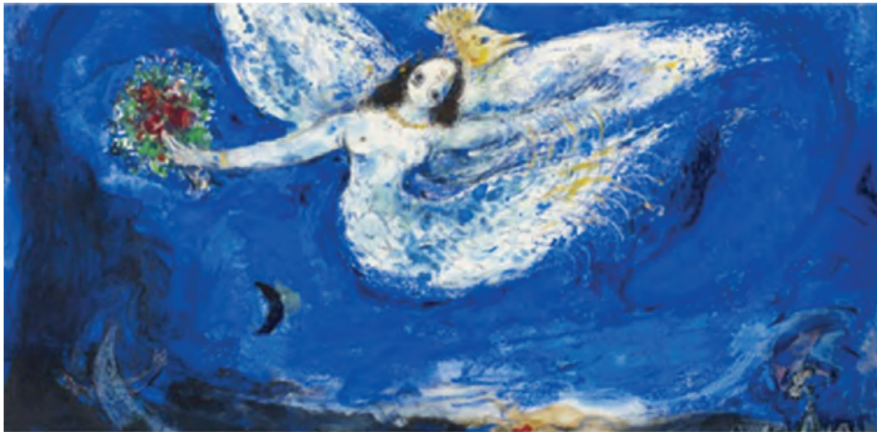
Μαρκ Σαγκάλ, Σκηνικό για το χορόδραμα Το πουλί της φωτιάς, 1945.