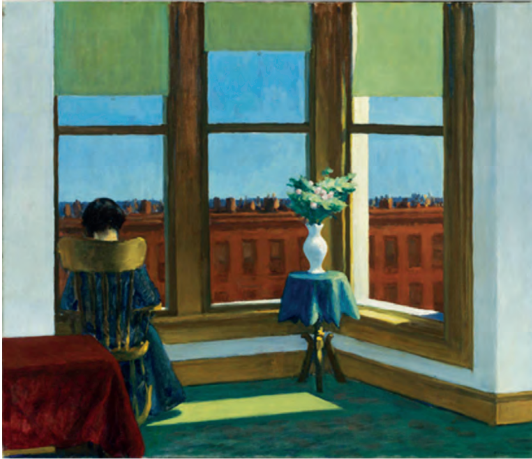
Έντουαρτ Χόππερ, Δωμάτιο στο Μπρούκλιν, 1932.