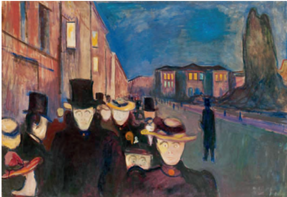
Έντβαρντ Μουνκ, Βράδυ στην οδό Καρλ Γιόχαν , 1892.