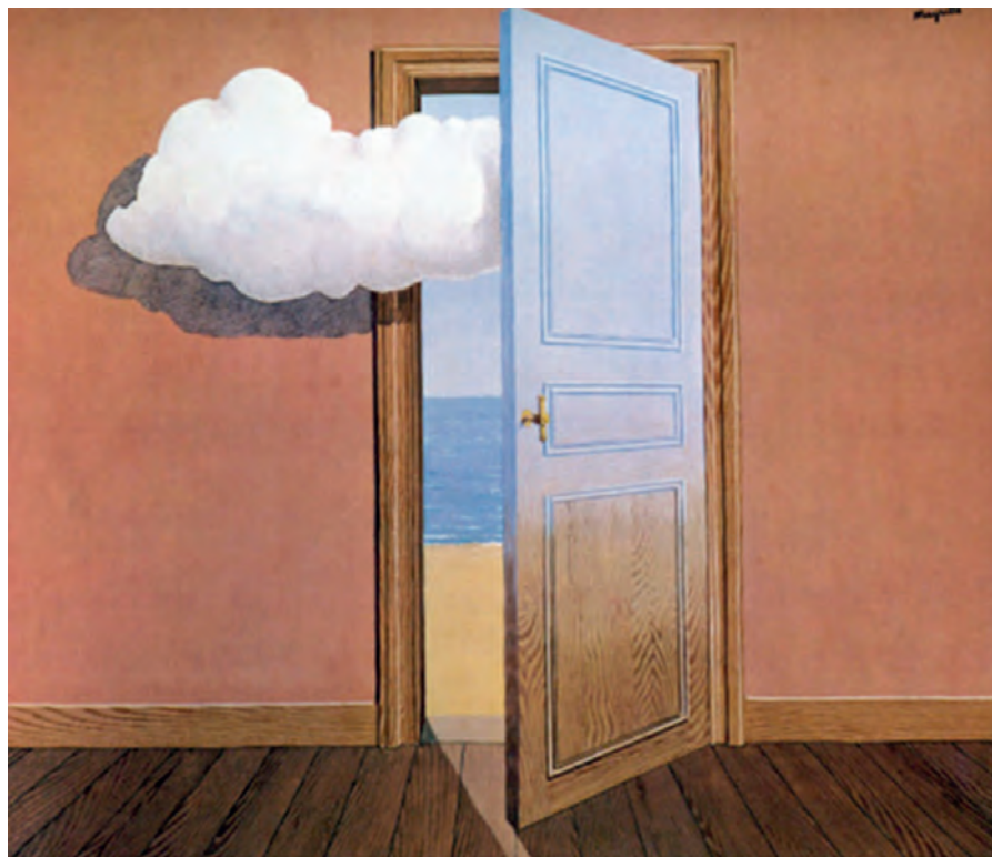
Ρενέ Μαγκρίτ, Το δηλητήριο , 1939.