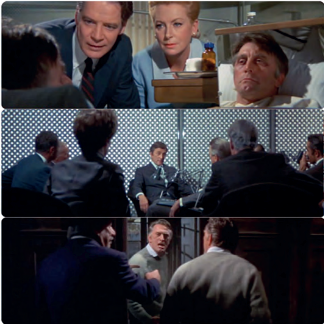
Ελία Καζάν, Συμβιβασμός , 1969