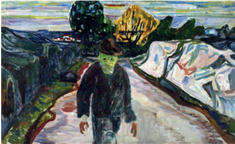
Έντουαρντ Μουνκ, Ο δολοφόνος , 1910.