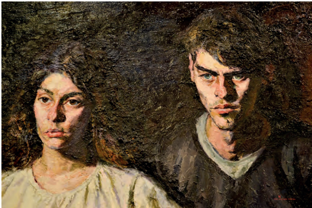
Στέφανος Δασκαλάκης, Δύο φιγούρες , 2011.