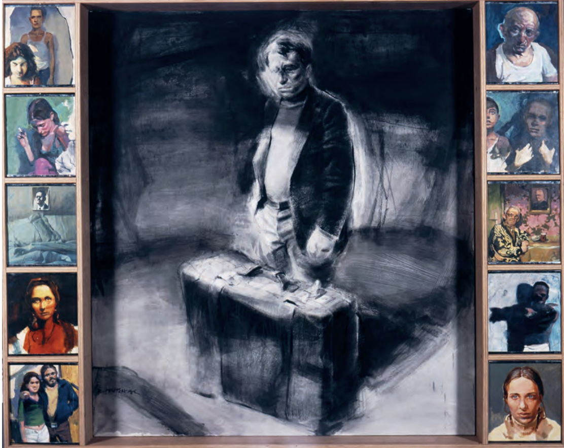
Μπήτσικας Ξενοφών, Ο Μετανάστης , 2002.