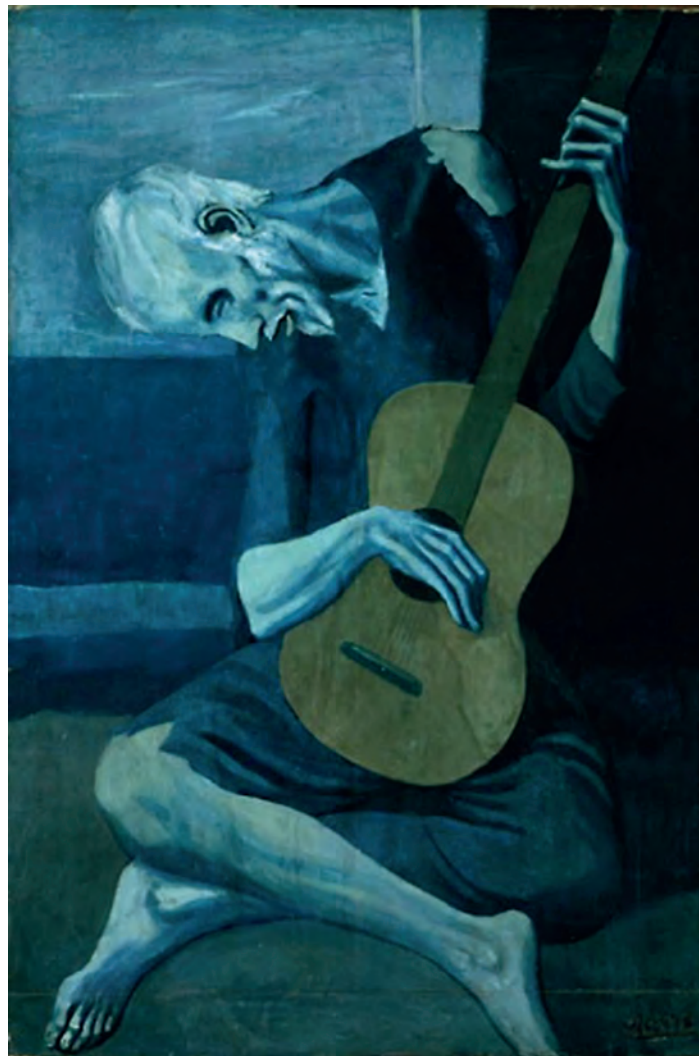
Πάμπλο Πικάσο, The old guitarist , 1903-1904.