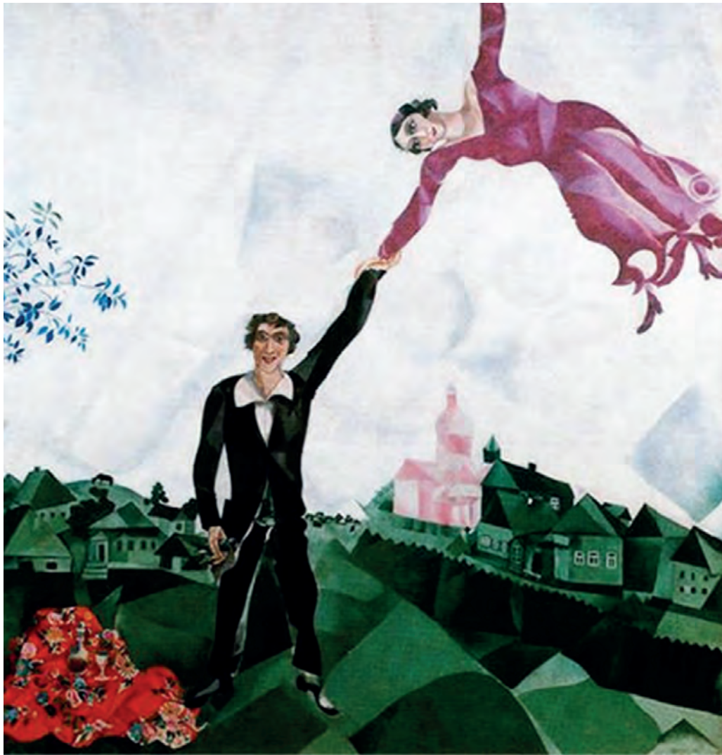
Μαρκ Σαγκάλ, Ο περίπατος, 1918.