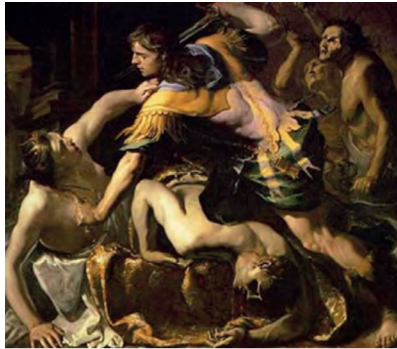
Μπερναντίνο Μάι, Ο Ορέστης σκοτώνει τον Αίγισθο και την Κλυταιμνήστρα , 1654.