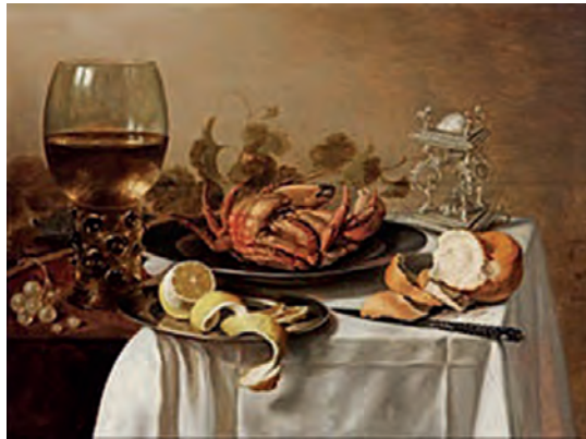
Πίτερ Κλες (1597–1660), Νεκρή φύση .