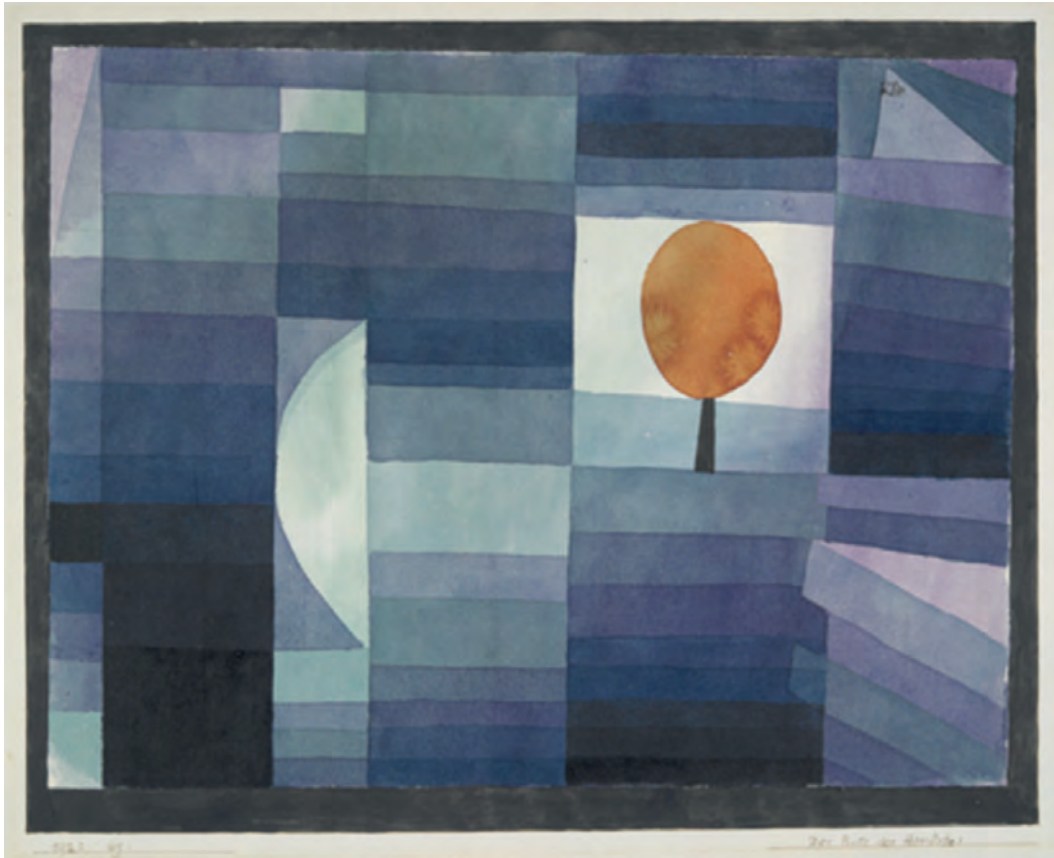
Πάουλ Κλέε, Ο αγγελιοφόρος του φθινοπώρου, 1922.