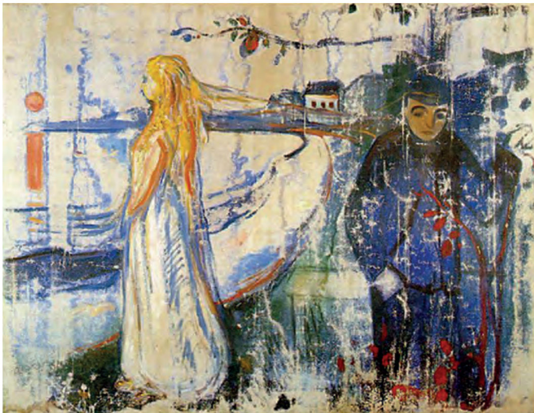
Έντβαρντ Μουνκ, Χωρισμός, 1894.