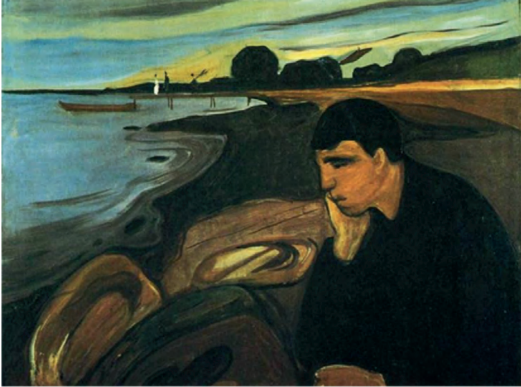
Έντβαρντ Μουνκ, Μελαγχολία , 1891.