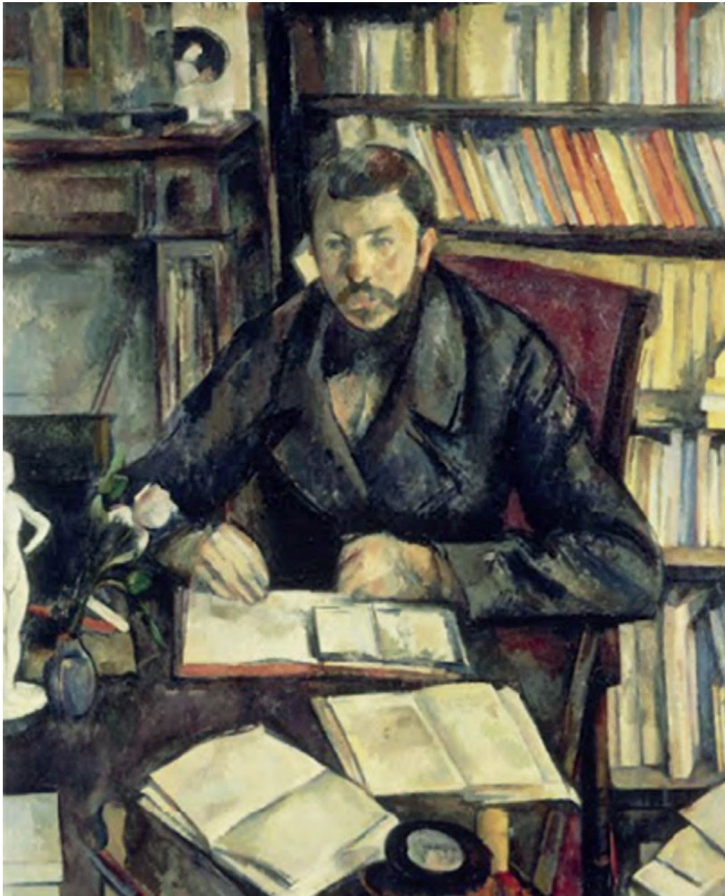
Πωλ Σεζάν, Gustave Geffroy , 1895 - 1896.