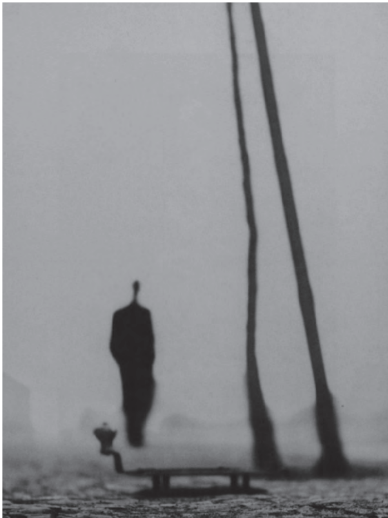
Γιόζεφ Κουντέλκα, Snow blizzard on the road to Korce. An Albanian braves the weather , 1994.