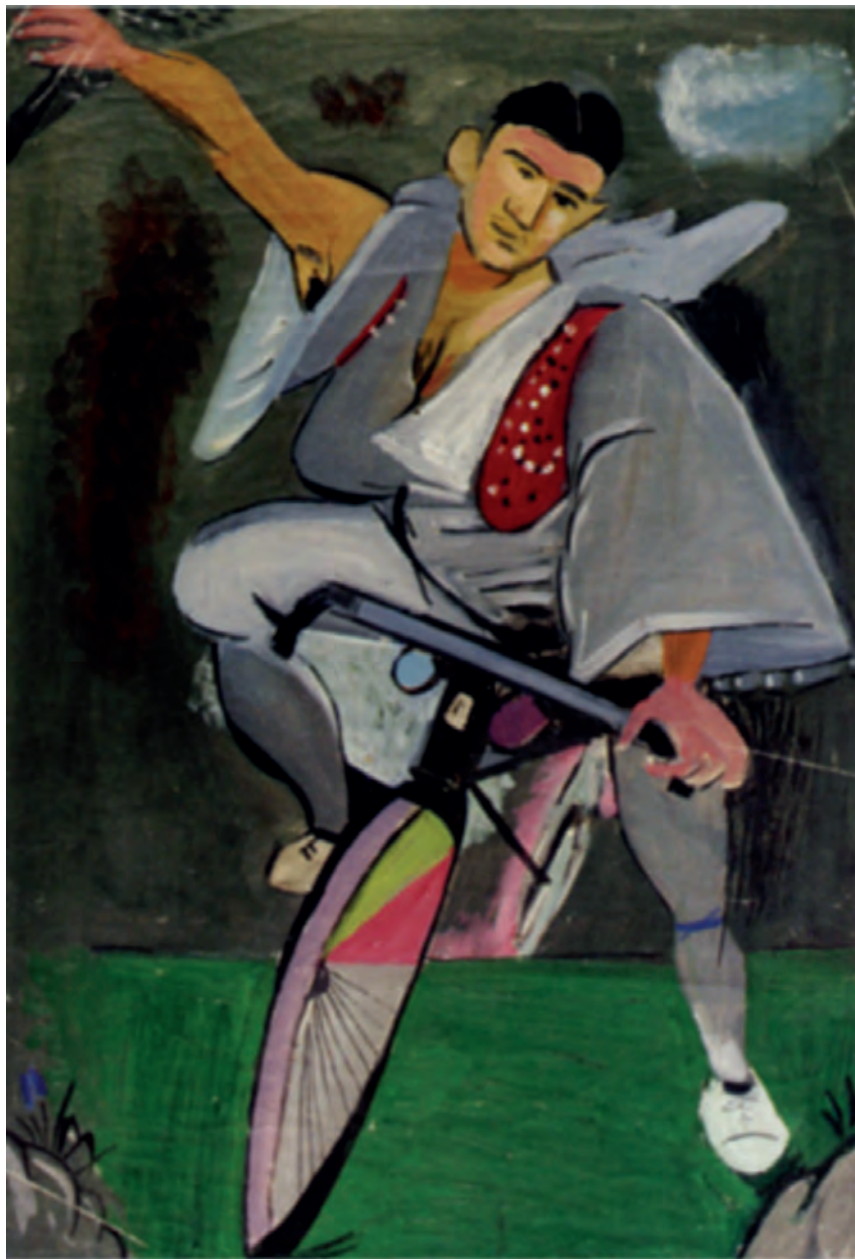
Γιάννης Τσαρούχης, Ποδηλάτης μεταμφιεσμένος σε τσολιά, μ' ένα νάο δεξιά κάτω, 1936.