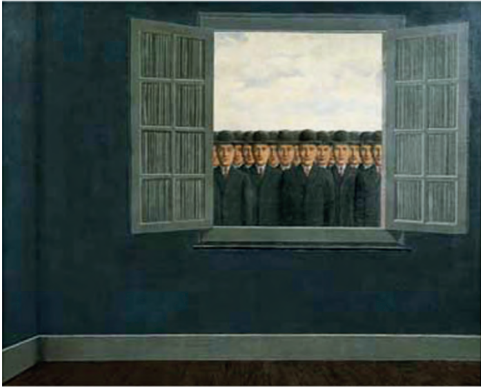
Ρενέ Μαγκρίτ, Ο μήγας του τρύγου , 1959.