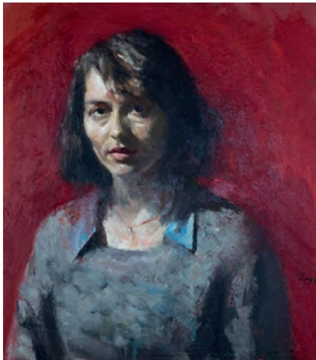
Γιώργος Ρόρρης, Πορτραίτο μιας νέας γυναίκας, 2013.

[Κοντός 1997 και Κείμενα Ν.Λ. 2015: 120]