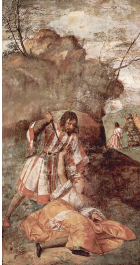
Τιτσιάνο Βετσέλλιο, Το θαύμα του ζηλιάρη συζύγου, 1511.