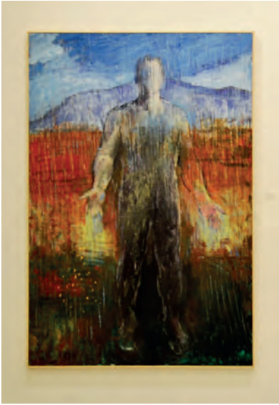
Μιχάλης Μαδένης, (χωρίς τίτλο), 2016.