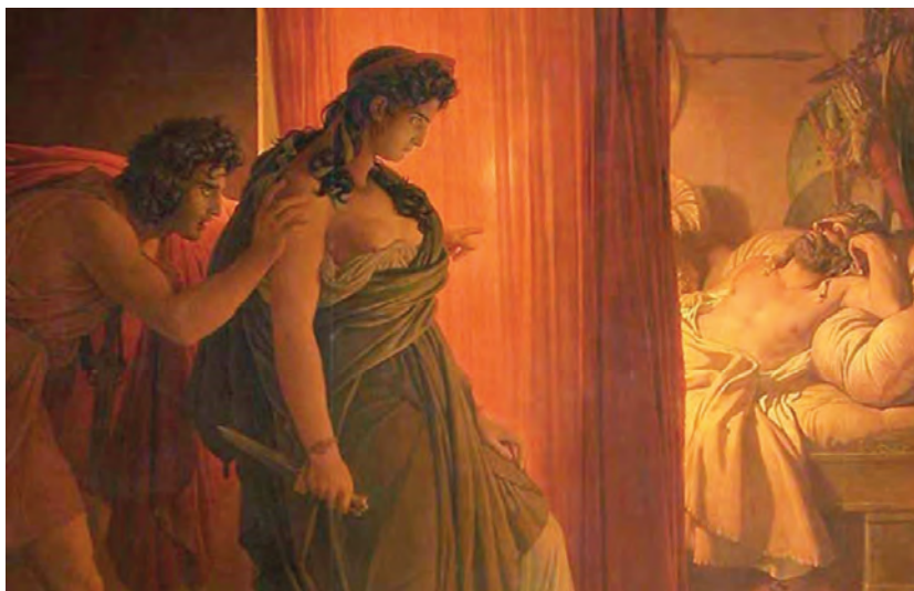
Πιερ-Ναρσίς Γκερέν, Κλυταιμνήστρα και Αγαμέμνων , περ. 1822.