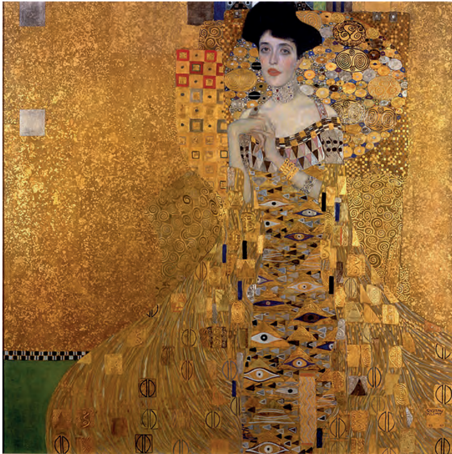
Γκουστάβ Κλιμτ, Πορτρέτο της Adele Bloch-Bauer I , 1907.