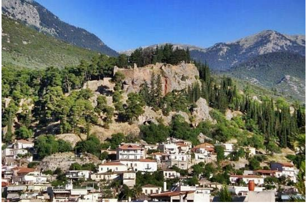
Κάστρο Άμφισσας (Κάστρο των Σαλώνων/της Ωριάς)