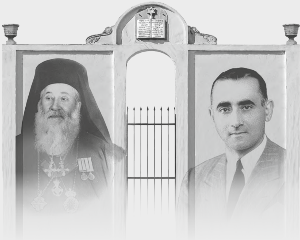
ΜΗΤΡΟΠΟΛΙΤΗΣ ΧΡΥΣΟΣΤΟΜΟΣ ΔΗΜΗΤΡΙΟΥ