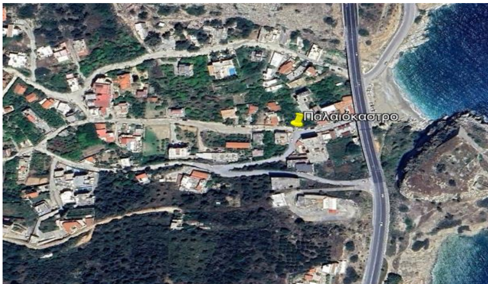
Εικόνα 4: Γενική άποψη της Τ.Κ. του Παλαιοκάστρου

Η Τ.Κ. του Παλαιοκάστρου, παρουσιάζεται στην παρακάτω Εικόνα 4 και αποτελεί την πιο αραιοκατοικημένη περιοχή.