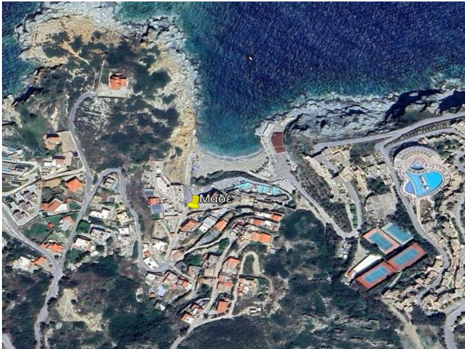
Εικόνα 3: Γενική άποψη της Τ.Κ. του Μαδέ

Η Τ.Κ. του Μαδέ, παρουσιάζεται στην παρακάτω Εικόνα 3 και αποτελεί την περιοχή με την μικρότερη έκταση.