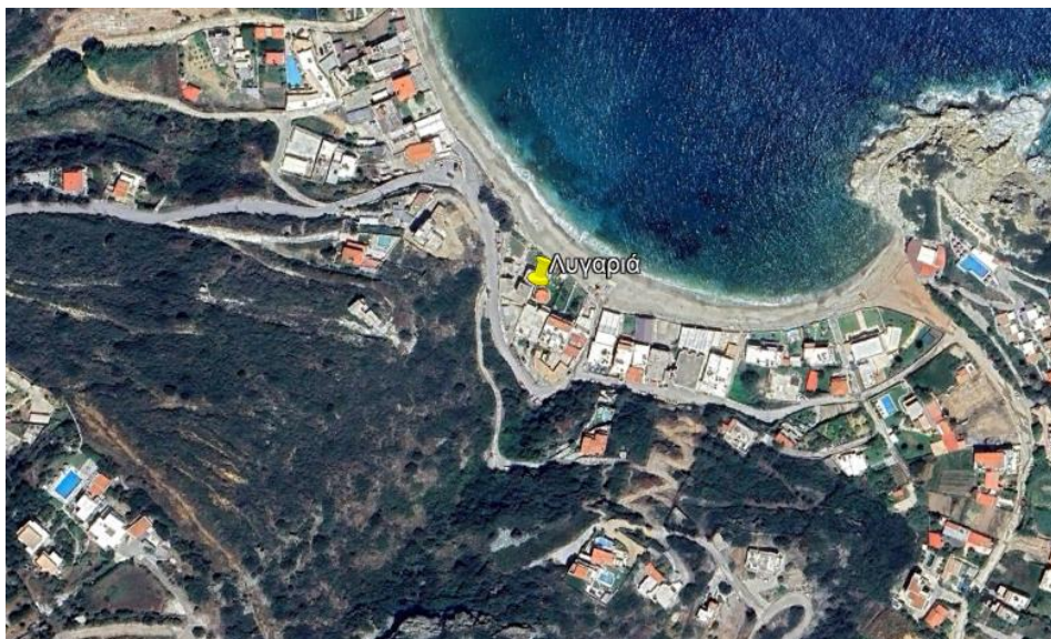
Εικόνα 2: Γενική άποψη της Τ.Κ. της Λυγαριάς

Η Τ.Κ. της Λυγαριάς, παρουσιάζεται στην παρακάτω Εικόνα 2 .