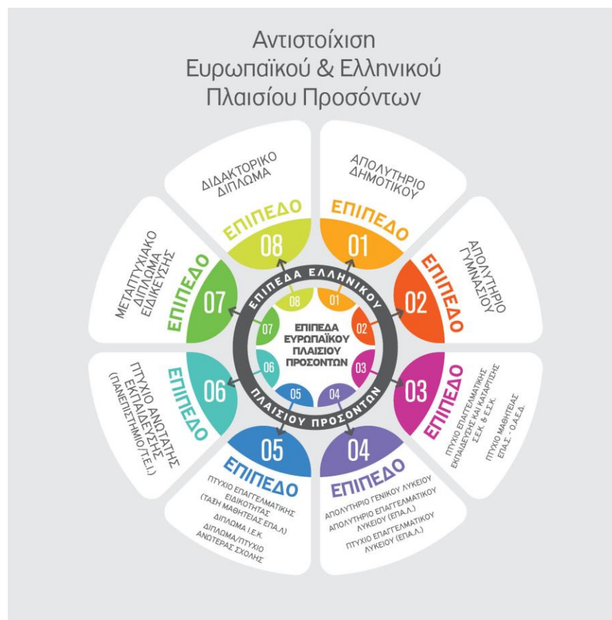
Εικόνα 1. Τύποι Προσόντων

Τα επίπεδα των τίτλων σπουδών που χορηγούν τα ελληνικά εκπαιδευτικά ιδρύματα και η αντιστοίχσή τους με το Ευρωπαϊκό Πλαίσιο Προσόντων είναι τα παρακάτω: