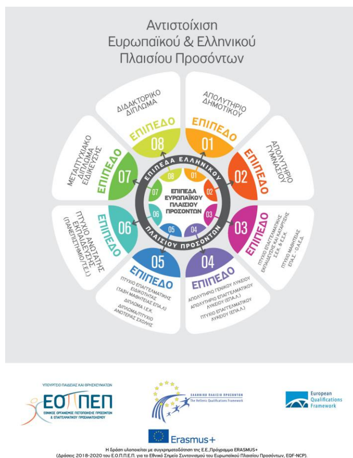
Εικόνα 1. Τύποι Προσόντων

https://www.eoppep.gr/index.php/el/qualification-certificate/national-qualification-framework