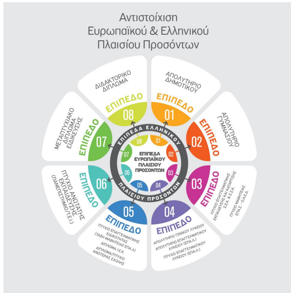
Εικόνα 1. Τύποι Προσόντων